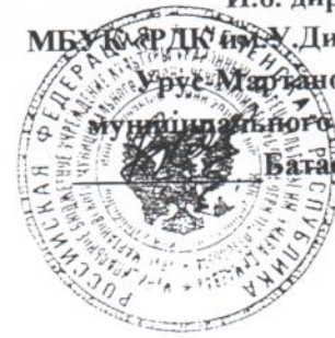
График репетиций кружков худ.самодетельности СДК